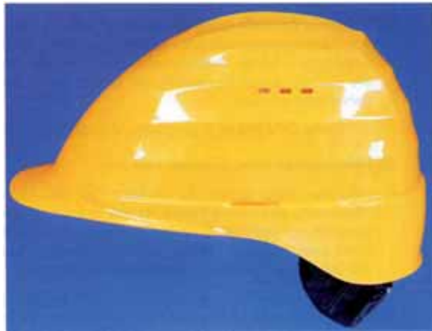
Bild 2: Industrieschutzhelm mit heruntergezogenem Nackenteil, Belüftungsöffnungen und seitlichen Schlitzern zur Befestigung von Zubehör (z.B. Gehörschützer), jedoch ohne Regenrinne