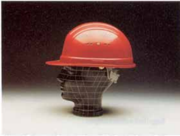
Bild 1: Industrieschutzhelm mit Regenrinne, Belüftungsöffnungen und seitlichen Stecktaschen zur Befestigung von Zubehör (z.B. Gehörschützer)