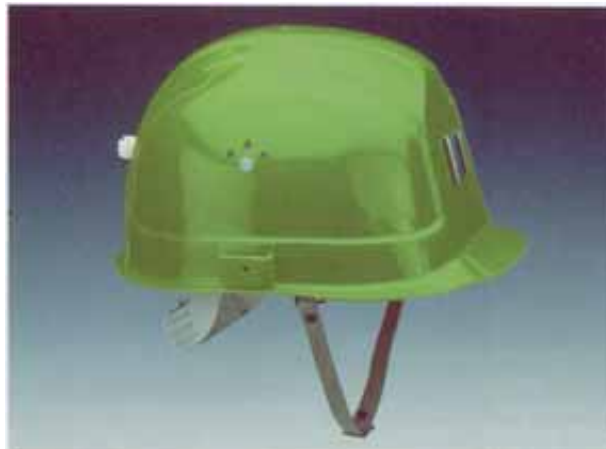
Bild 3: Industrieschutzhelm mit verkürztem Schirm, Lampen- und Kabelhalter, Kinnriemen (Zubehör)