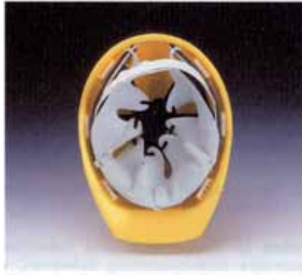
Bild 9: Industrieschutzhelm für Kopfverletzte mit Zackenleder-Innenausstattung