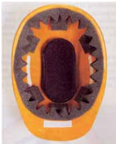
Bild 8: Industrieschutzhelm für Kopfverletzte mit Schaumstoff-Innenausstattung