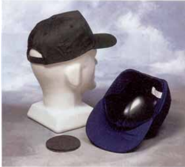
Bild 6: Industrie-Anstoßkappe mit textiler Umhüllung als Schirmmütze