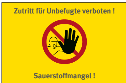
Abb. 3 Beispiel einer Kennzeichnung am Zugang zu einem sauerstoffreduzierten Bereich im Alarmfall – Leuchttabelleau

Das Abschalten des Alarmes ist erst zulässig, wenn durch die Leuchttabelleaus an den Zugängen zu den gefährdeten Bereichen oder durch Absperren der Zugänge sichergestellt wird, dass unbefugte Personen die sauerstoffreduzierten Bereiche nicht mehr betreten können.