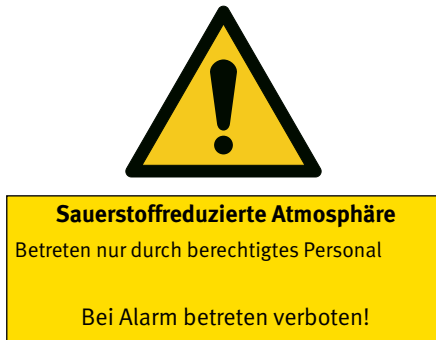
Abb. 2 Beispiel einer Kennzeichnung am Zugang zu einem sauerstoffreduzierten Bereich

An allen Zugängen sind Schilder anzubringen, die auf die sauerstoffreduzierte Atmosphäre hinweisen und den Zugang nur für berechtigte Personen zulassen. Die Zeichen müssen der Technischen Regel für Arbeitsstätten „Sicherheits- und Gesundheitsschutzkennzeichnung am Arbeitsplatz“ (ASR A 1.3) entsprechen (Abb. 2).